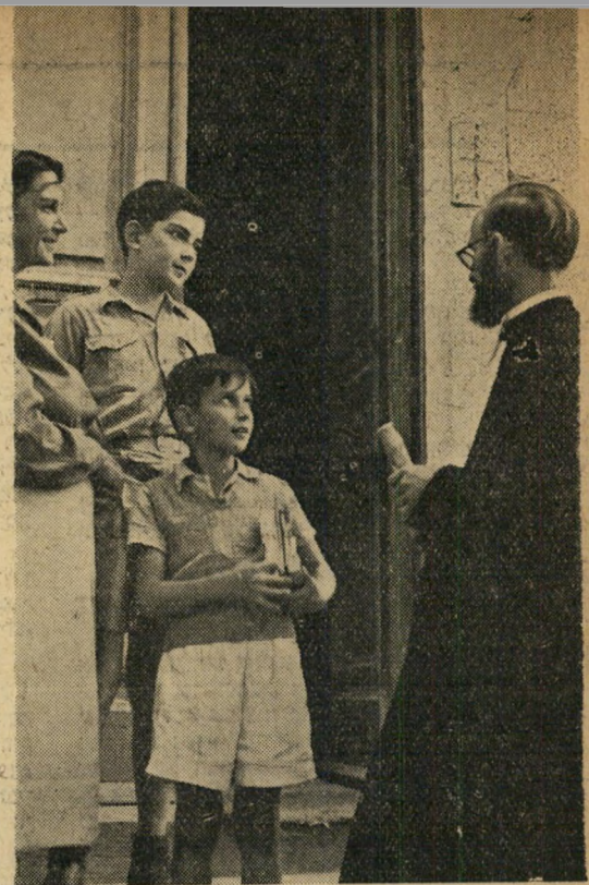
האם זה אה? לא מכבר עלתה ממצרים והביאה את ילדיה לקולנו. עוד מימי ילדותה מכירה היא את המוסד הזה, וגישת ה"אחים" לתלמידים מוצאת חן בעיניו. כאן, כאן, היא אומרת, לא ישכחו ילדיה את השפות שכבר התחילו ללמוד בחוץ-לארץ, וגם ילמדו טפה חדשה: עברית.