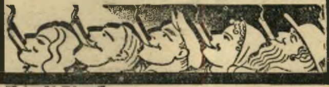
פרסום גרשון בן