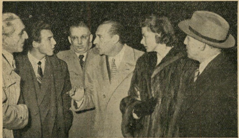
רוסליני, אינגריד ועתונאים בבית-המשפט. כאשר הופיעה מהדורת ר. ק. אה. של "סטרומבולי" בפרס (היא המהדורה המוצגת עתה בתל-אביב) החליט רוסליני כי סרטו טוב. הוא בא לפרס והגיש משפט נגד "מסרטי יצירתו". התוצאה: פרסומת

המגרעת הראשית בסרט היא — כפי הנראה — אהבתו של הבמאי לשחקנית שלו. האהבה, אומרים, מסננת, והיא עיוו' רה את עיניו של רוסליני, עד שלא ראה