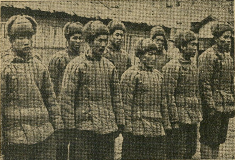
חיילים סיניים שבויים מכה אחת היתה מספר-קח