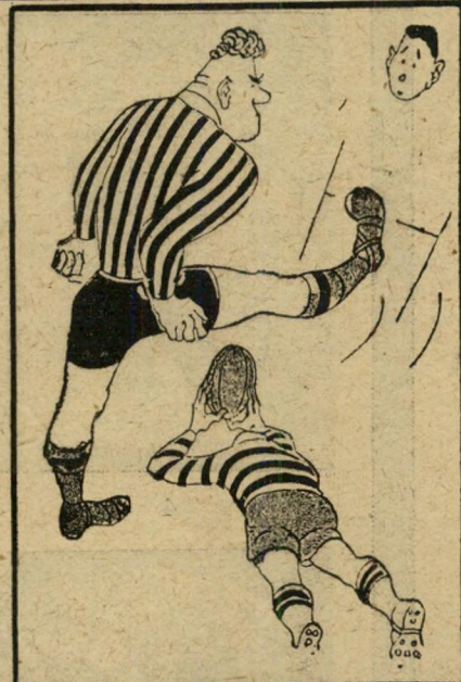
"אידה בעיסה נהדד" (סטרופ)