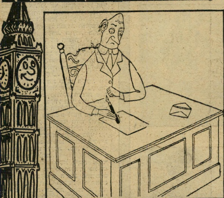
"א.י. אני מתפלל שלא קבלתי תשובה על שני מכתבי הקודמים..." (איחוד)