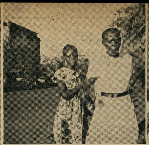
תושביה הינה עיר. אליה באים, בימי חג, ראשי שבטים כמומבה האלמוני (בצבא הבריטי) במרכז העיר (למטה). מוכר הממתקים ת פולין. שני הכושים, חיילים משוחררים לבושים בגדי השחרור.