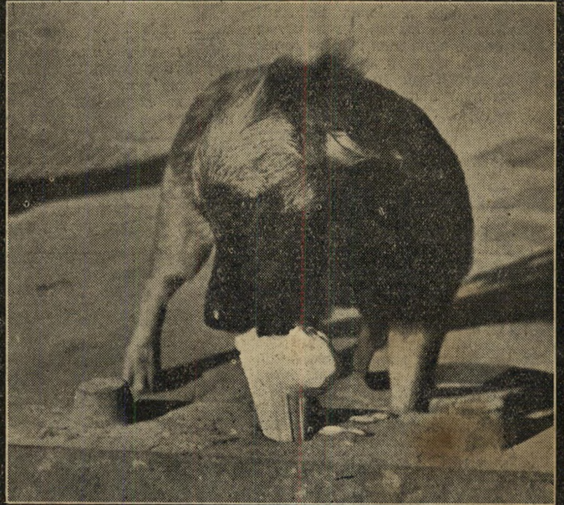
1. „...חבריא, אני משתגע אחרי גלידה...”