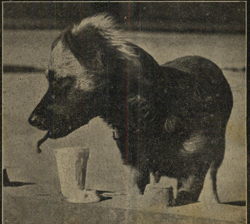
3. ...חכו, הלשון קפאה...