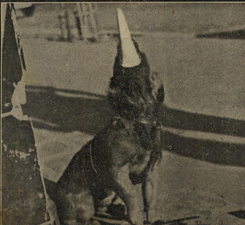
6. ...זהו זה!