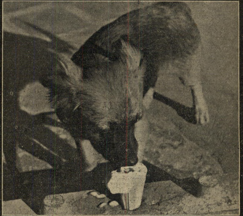
2. ...המזמזמ... לגמרי לא רע...