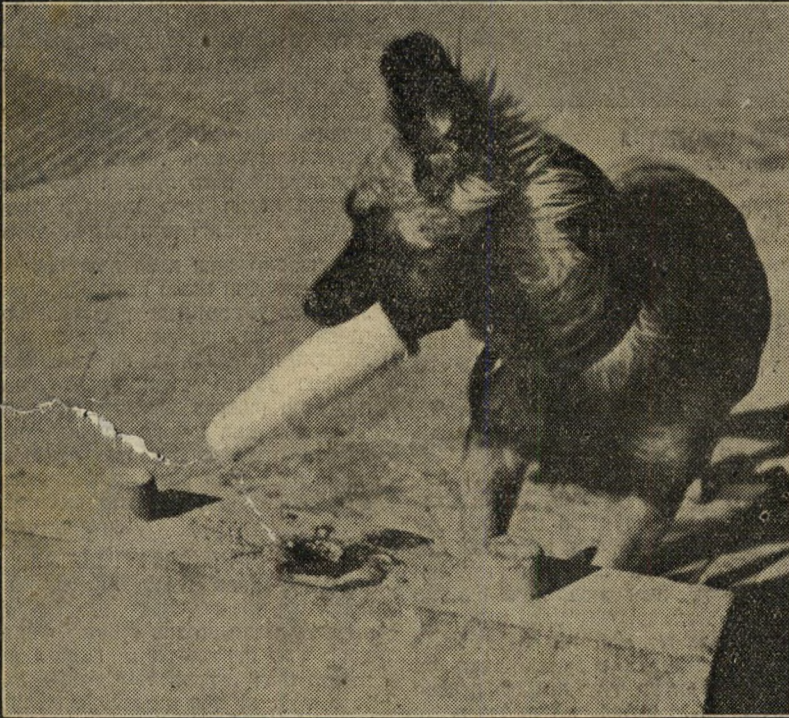
5. עכשיו תדאו איך אני אוכל את השאר...