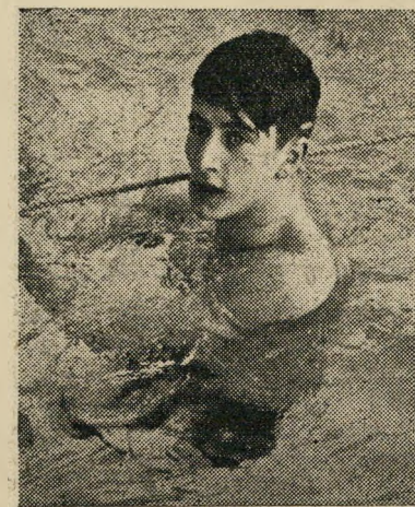
השחיין רובבלו שלנברג הכסף של אבא עזר.

הציבור הדרום-אמריקני ידוע בתלהבו-תו הספונטני והחזקה לספורט, ולפעמים נצחון על קבוצה יריבה עולה במספר קורבנות (לרגל התפרצויות השמחה הפעל-תניות). הדרום-אמריקניים סיגלו לעצמם את משחקי התנועה והכדור, אך גם בשטח האינדיבידואלי אין הם מפגרים. בתחילת