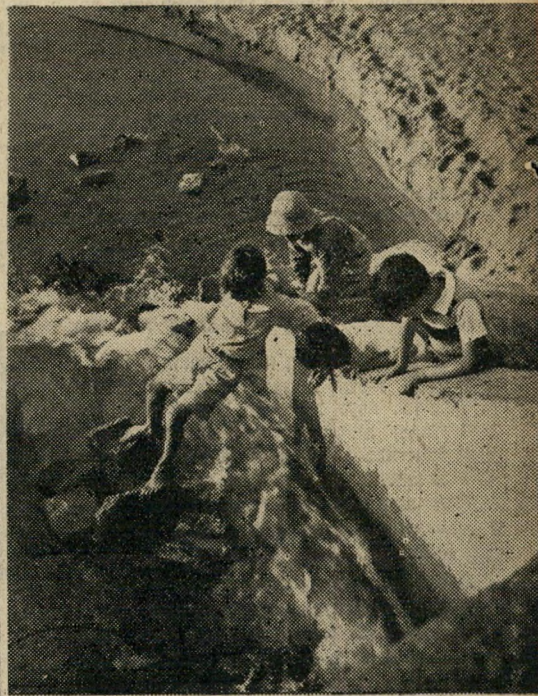
מגורש משחקים: ילדי "השטח" מבליים את ימיהם מסביב לתעלת הביוב. בקרבת המקום אין גן צבורי. על גן-ילדים איש לא שמע כאן.