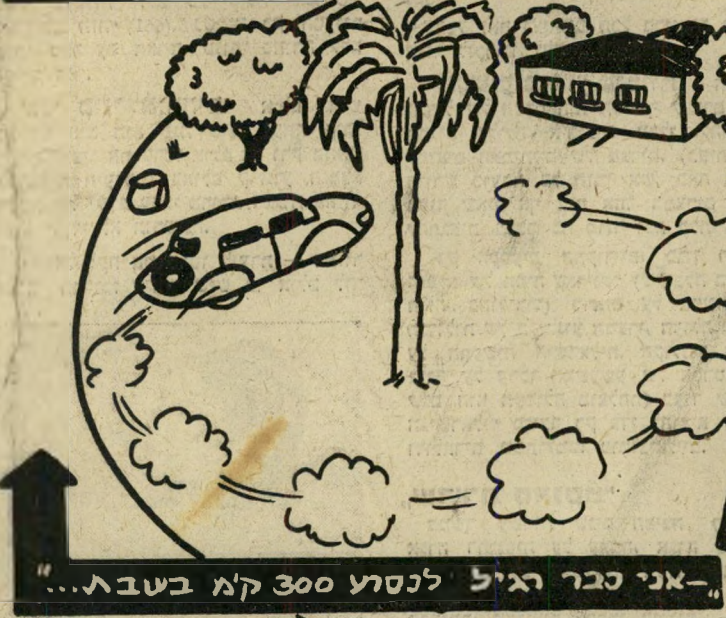
אני כבר רגיל לנסוע 300 ק"מ בשבת...