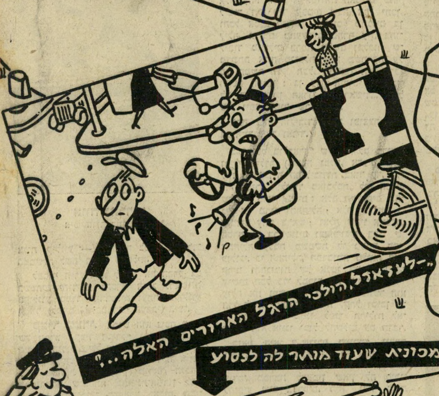
לעזאזל, הולכי הרגל הארוכים האלה...