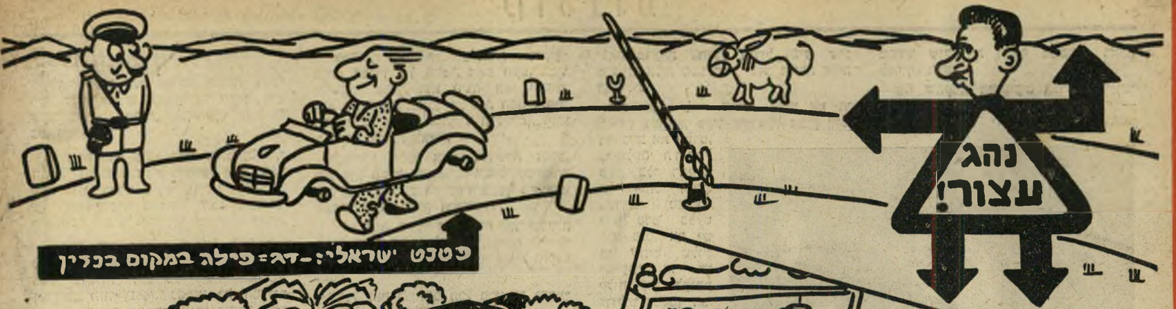
כטנט ישראלים - דג - פילה במקום בכדין