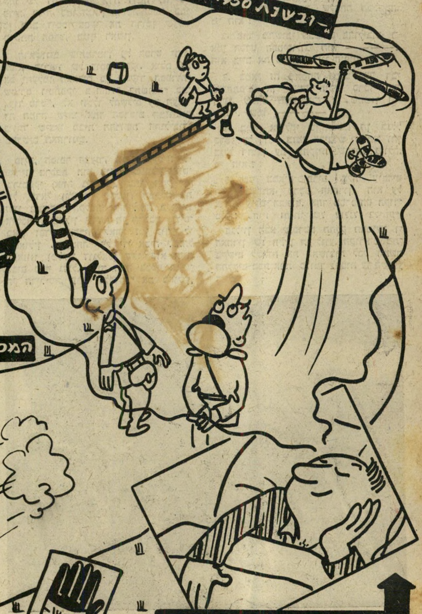
חלומו של בעל המכונית