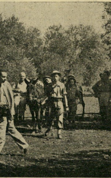
הפרד, החיילים והצלמים הצלמים הכריזו חרם.

הכל מה.ס.מ.מ. עד לאחרון השוטרים. ואמנם, הדברים לא היו נעימים ביותר. ל"סקופ" שלך יש ריח של בחירות, התריסו העתונאים כלפי סופר "חרות" שהביא בעתונו ידיעה על דבר 4 פקחי אנף הפיקוח שנעצרו באשמת מיקוח שוחד בחיפה. אמנם ברחובות רופה שמועה סנסצ'יונית ומנופחת אחת אחר חבתה — (5 פקחים, אחרי שעה — 10 פקחים — פקח ראשי, מגחלי מחלקות ו...) אך ממקור רשמי לא היה כל אישור לידיעות. עם כל זאת "רבצו" הרפורטרים לפי התור ליד פתח בית משפט השלום בחיפה, בתקווה שאולי — אולי בכל זאת?