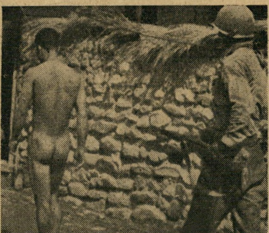
עדינות אמריקאית. למה לחפש נשק חבוי בבגדי שבויים? הרי קל יותר להפשיט אותם.