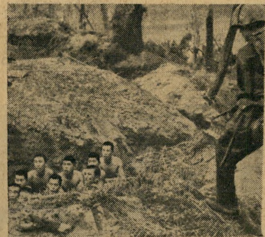
תחנות בניינים. אם יתפנה מישהו כדי לספול בשבויים הצפוניים, מה טוב - ולא...

הודות למלחמה. לפני פרוץ המלחמה, ירדה השפעתו של רי וממשלתו עמדה על סף פשיטת-רגל פוליטית. ההתנגדות גברה לא רק בקרב תושבי המדינה אלא גם בחוגי השלטון האמריקאי. עד אשר פרצה המלחמה. תהה צומד צבאו של סינגמן בגבולותיה הצפוניים של הארץ. הוא תובע לעצמו שליטה על כל הארץ כאילו הדבר מובן מאליו. כבר היום, מתיחס רי אל החלטות או"ם כאל החלטותיה של מועצת הנבחרים של דרום קוריאה. הוא "אבי עמו", הוא תובע, ועל או"ם לאפשר לו "לאחד" את הארץ. כל החלטה אחרת היא חסרת תוקף פוליטי ומוסרי בעיניו.