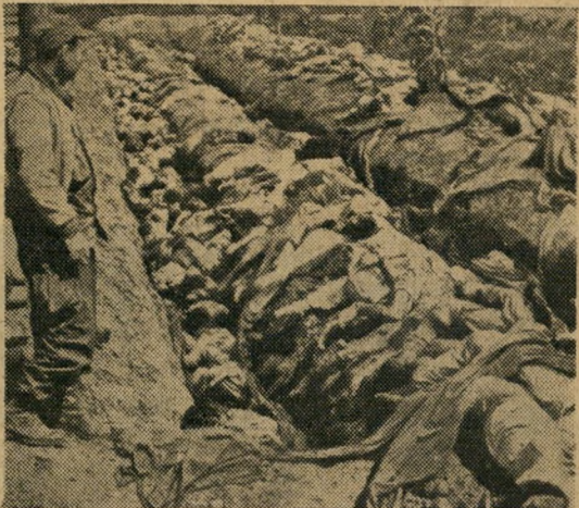
תוצרת קומוניסטית. עם כיבוש טייג'ון בידי האמריקאים נתגלו 400 גויות של דרומיים.