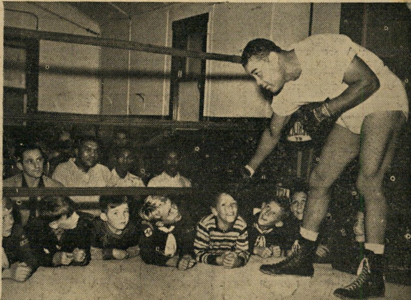
ג'ו לואיס ומעריציו לפניין