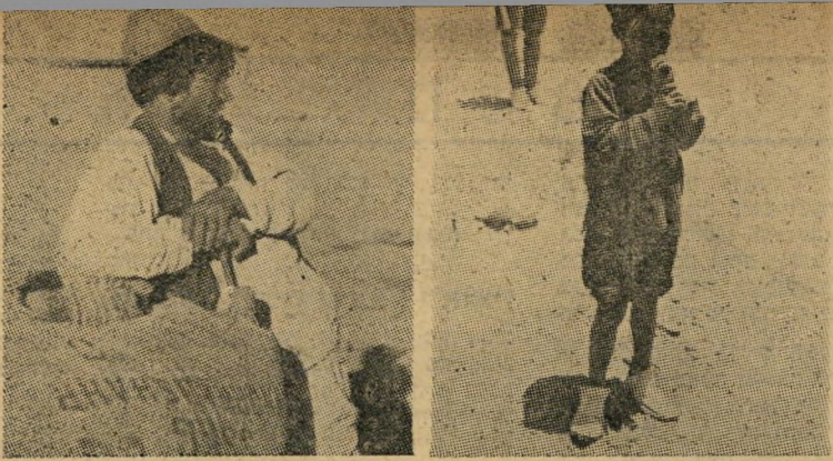
הילד והאיכר שאינם פוחדים מפני פנישה. "מה יש לנו להפסיד?"