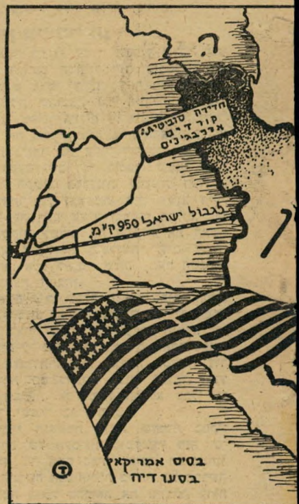
צעות והמזרח התיכון