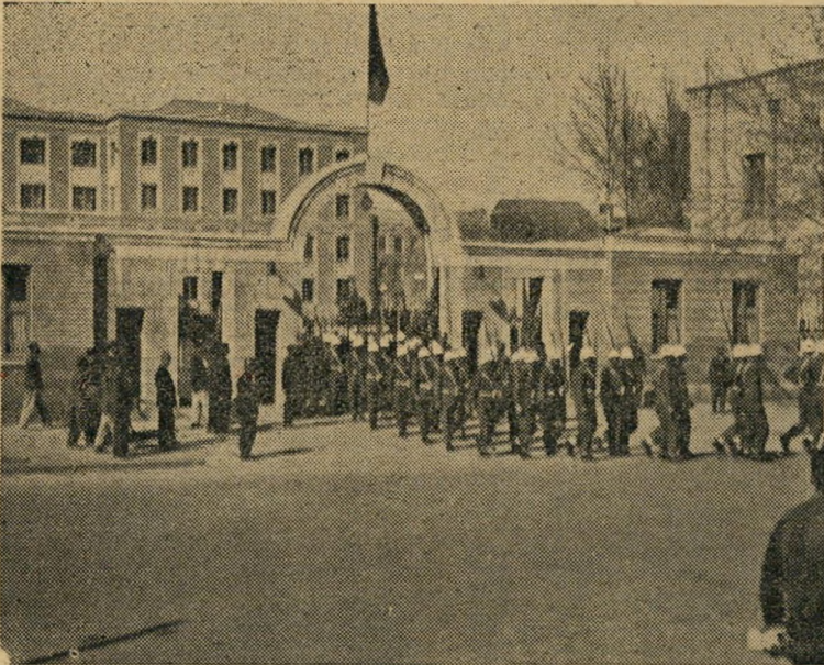
הצבא שיצטרך להגן. הנשק וכובעי הפלדה — גרמניים. הפרטים מצטיינים כלוחמים.