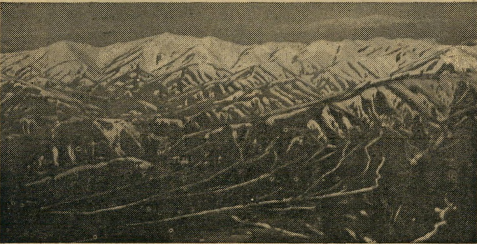
הנוף המרהיב העלול להיות לשדה קרב. שטח איראן גדול פי 40 משטח ישראל.