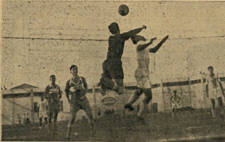
בנדרוי מוריד כדור מראש בוצ'קה מתעורר תיאבון הקהל...