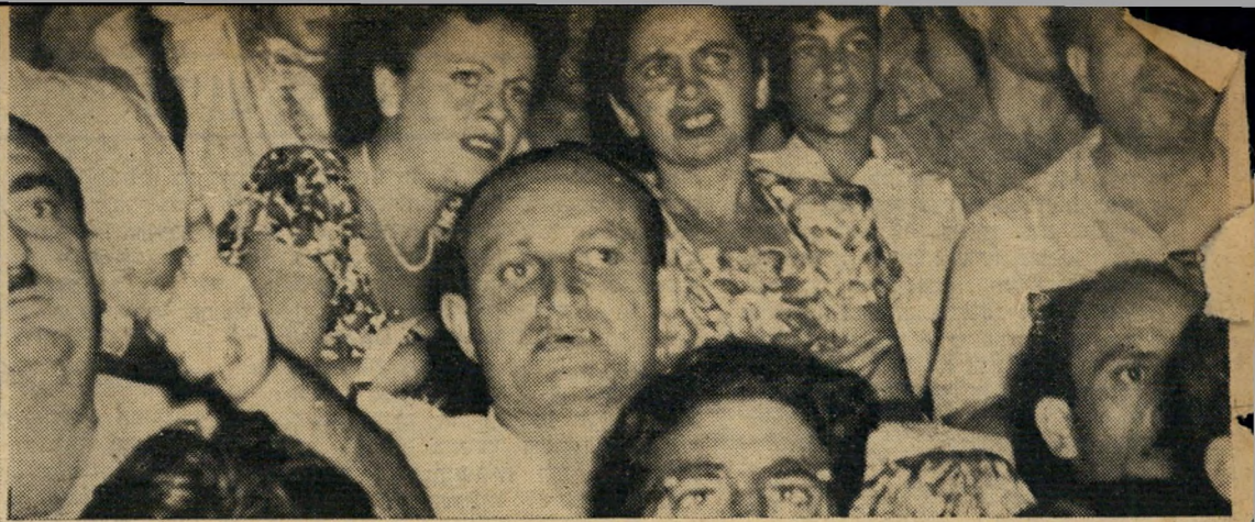
הלחלה נעימה: האשה המתמוגגת בכאב, אשר שכנה לועם מאסטיק