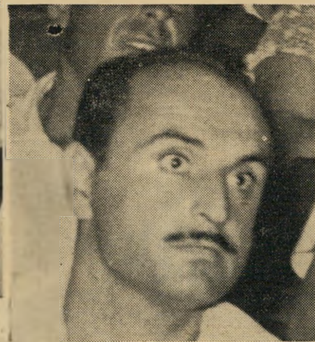
כאב סוער: נכה קטוע-רגל חווה במפלת גיבורו