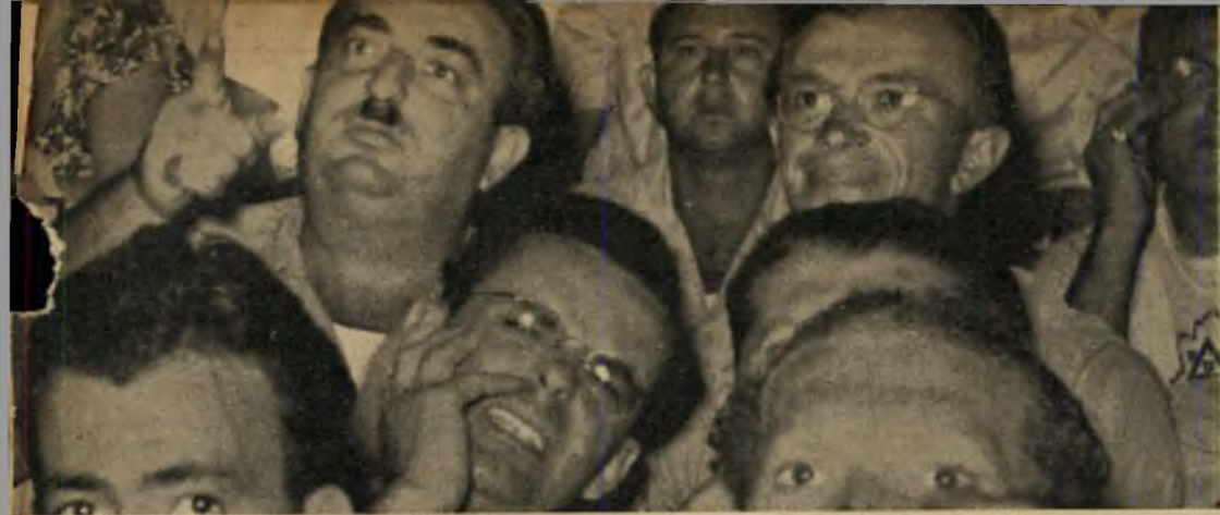
חזרה מוחלטת: האדם הממשש לחיו כאילו הוא שפסג את המכה