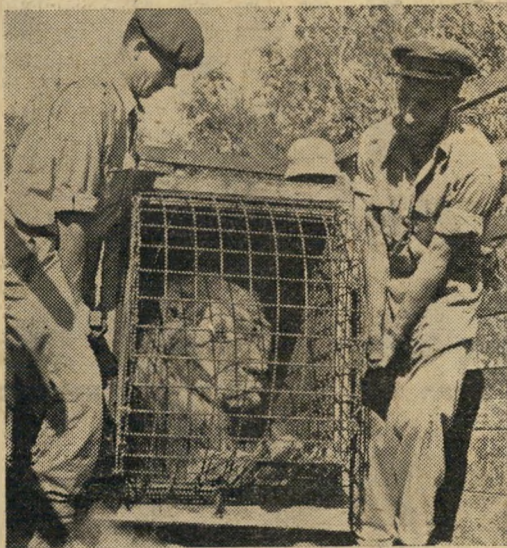
...הזהרו, לעזאזל, קצת בערינות...