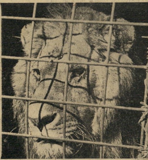
...ובכך, נוסעים היום?...