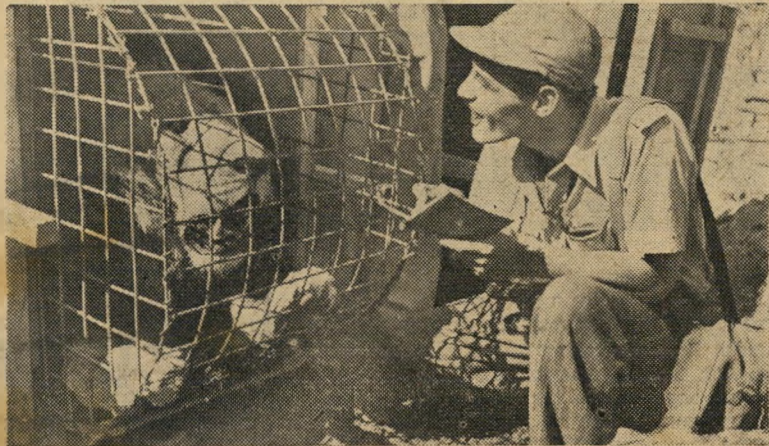
...מה, שוב נודניק מ'העולם הזה?'