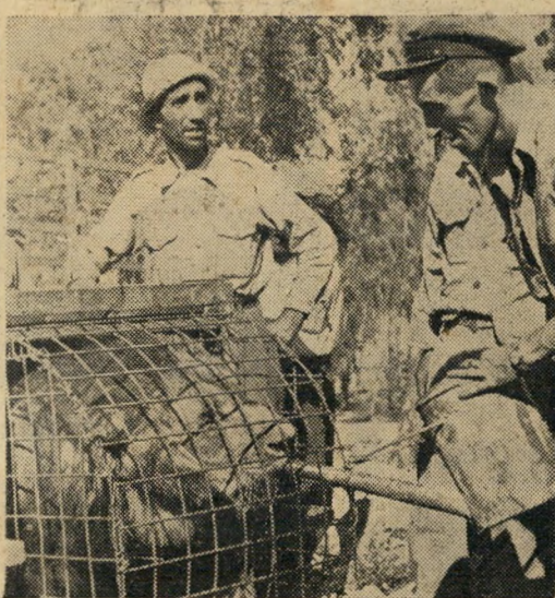
קודם כל, תנו לשתות...