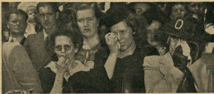
ההמון מכבה את המרשל שאיחד את עמי אפריקה הדרומית