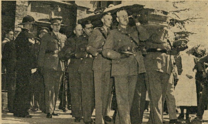
על הארון מונחים כובעו של המרשל, חגורתו וחרבו