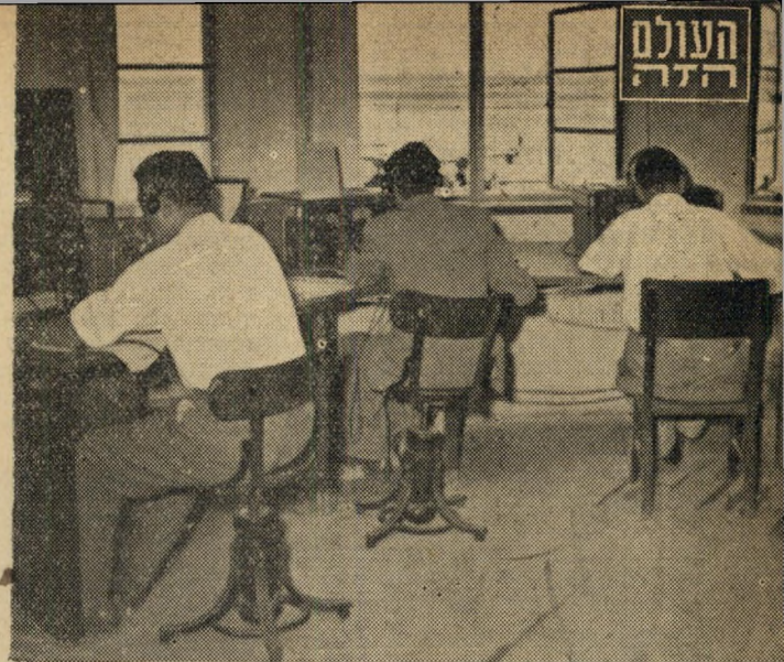
1. חדר האלחוט : מן הרגע בו ממריא המטוס ברומא או ציריך בדרכו ללוד, הוא נמצא בקשר אלחוטי מתמיד עם חדר זה ומוטר פרטים על התקדמותו. האלחוט פועל בגלים בינלאומיים קבועים, אשר כל המטוסים נכנסים לתוכם. הקשר אינו ניתק אף לדקה אחת. לקריאות-חירום שמורים גלים מיוחדים.

תצלומים : 7. שמו 6. אווירא בינלאומית : למלון "השרון" אפשר לשמוע (לא מעטים האנשים הבאים הנ