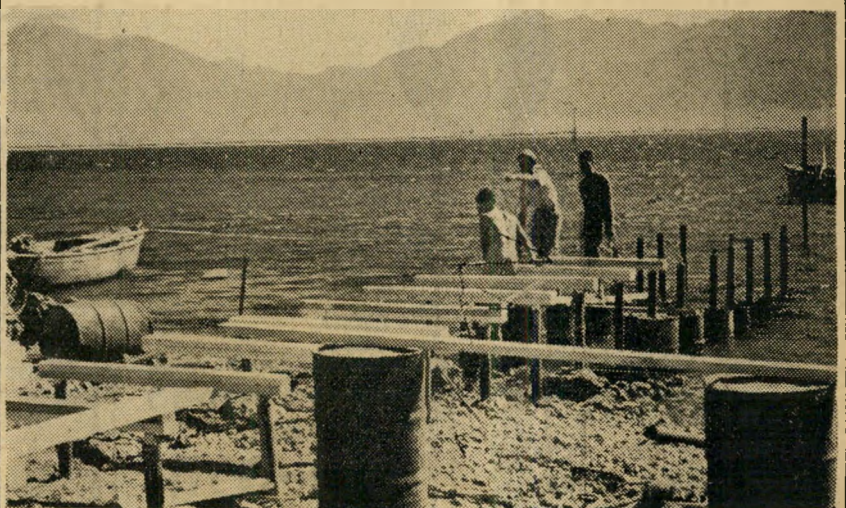
המזח: מסרים אחזים מן החוף עמוקים המ'ס. בכל זאת היה דרוש מזח פרימיטיבי זה.