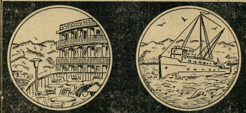
שני מקורות-עושר פוטנציאליים — דיג בממדים גדולים והארכת תיירים מכל העולם.