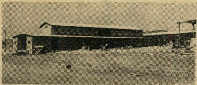
בית ערבי הותקן כאכסניה — אך לא הוא ימשוך תיירים מפונקים.