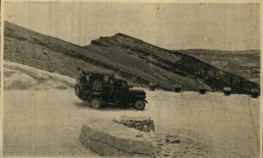
הכביש: פעם ארכה הדרך מבאר'שבע 17 שעות. היום מגיעה כל מכונית ב-7 שעות.