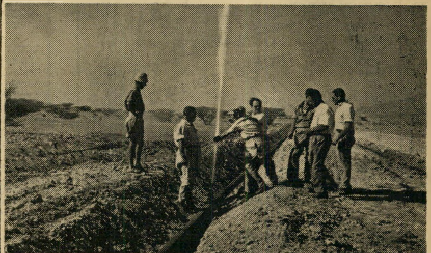
המים: הצנור המעביר את הנוזל החיוני מבר'הינדים לאילת הושלם רק בחדשים האחרונים.