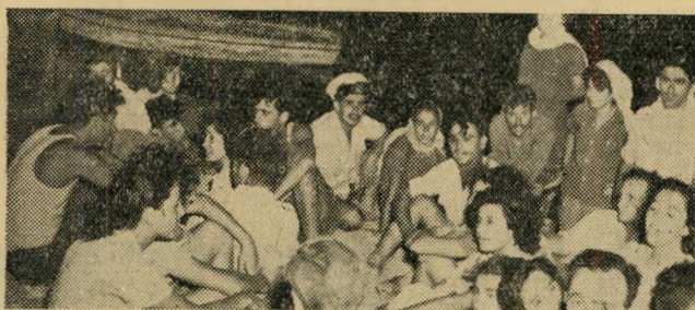
הנוער מבקר באילת — אך לא הוא יכניס לאוצר את המטבע הזר.