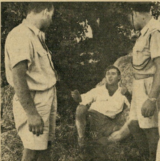
נהג ההמום מנסה להסביר מה קרה