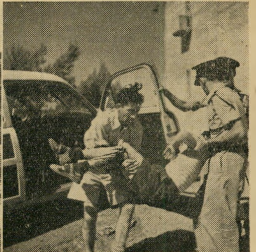
הפצוע הראשון מובא למשטרת נבייושע