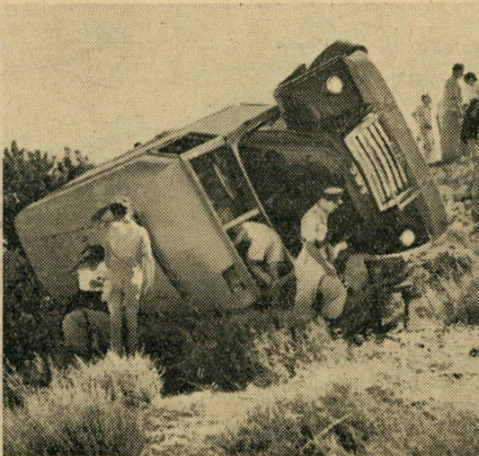
המשטרה יוצאת למקום ומוצאת את האוטובוס מוטל על צדו