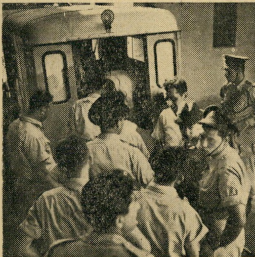
האמבולנס שהועק למקום מעביר את הפצועים