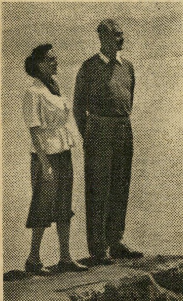
לואי נפוליון ועדים בונאפארט הרפובליקה התנגדה לנשואיו

רק פעם אחת בחייו גרם אי-נעימות לרפובליקה. היה זה כשהחליט לשאת