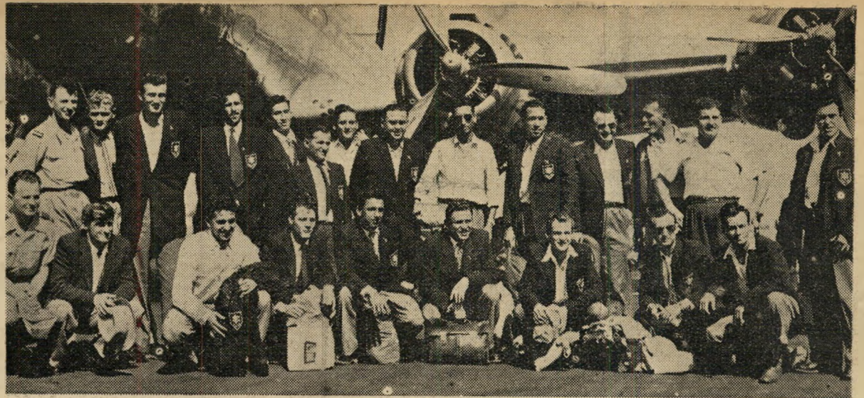
המכבים החוזרים בשדה התעופה בלוד 6 נצחונות, 5 הפסדים, 4 תיקו.

הוא הסכום המסוער שתביא לתומורת הישראלית נטיעתה לאמריקה. כרטיסי כל הקונצרטים שהא תערך בארצות הברית כבר נמכרו מראש ויש סיכויים טובים כי המוסד יצליח בשליחתו האמנותית וזאת לא פחות בשל היותו מוסד ישראלי מאשר בשל רמתו, אשר כשעצמה עולה על רמת מוסדות אמנות אחרים שלנו, שניסו את מזלם עד כה בחוץ לארץ. באיוז מידה מוצדקת נסיעתה של התומורת שלנו לחוץ לארץ, האמנם רשאת היא לשלם מחיר יקר כזה בבילי התעמולה, באיוז מדה מוצדקת "עריקתה" מוויית הפנים לתקופה של שלשה חודשים, בה בשעה שרובות הושבי הארץ זקוקים למוטיקה שלה — כל אלה נותחים בלי ספק פתח לויכוח. לוח המגנט וארגון הנטיעה לאמריקה, אף הם מעידים יותר על מטע מבני מס' זוריתתעמולתי מאשר "נות חרות עם זוא" מות. חבר המנגנים של התומורת מר פיע כאן כ"בשר תחתים". אך גמרו את עינת העמל ובר, כעבור מסגר שבועות, מתחילה העונה החדשה עם עשר חזרות על כל קונצרט (לא לפני הקונצרט...)