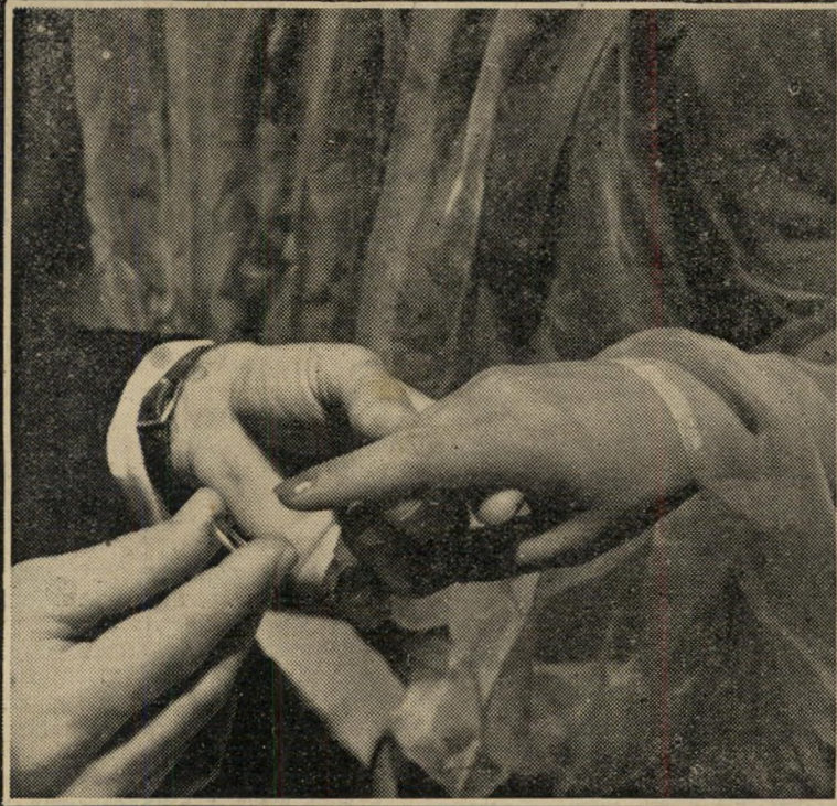
מְקַדְשֵׁת לִי אֶת