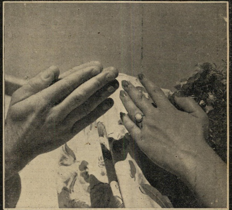
הַחֲלוּם הוּא כְּבִיר