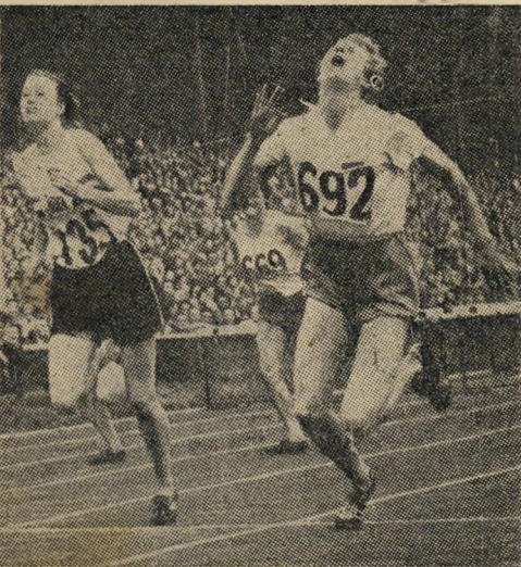
בלנקרס קון האלופה ההולנדית

ההזנחה האיזומה שהיתה מנת-חלקה של המכביה במחצית השנה האחרונה, מבחי-נה אירגונית וספורטיבית גם יחד, אינה ניתנת עוד לכפרה.