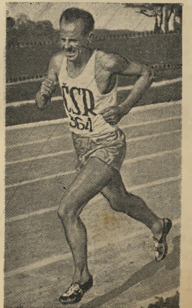
הרץ הצ'כי אמיל זטופק

אלה ה"מסכנים" שאינם מתעניינים בס-פורט, לא שמעו מימיהם -- ולא ישמעו לעולם -- על פאני בלנקרס-קון, "ההולנ-דית המעופפת" בעלת 4 שיאים עולמיים,