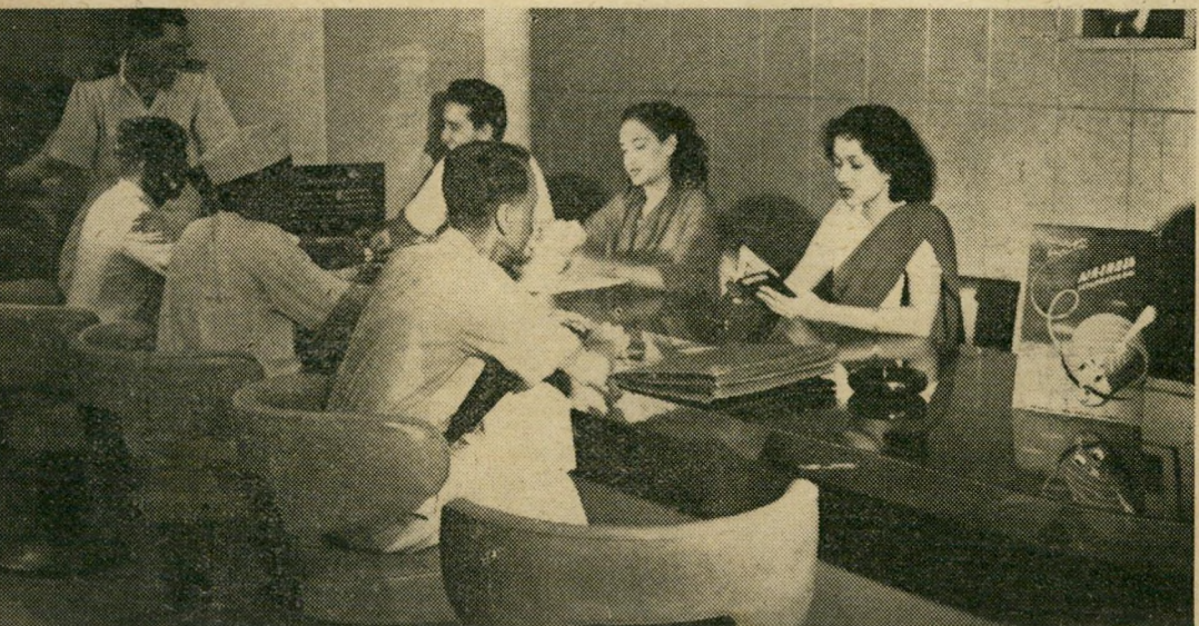
האשה של אתמוז: עבודה מפרכת, משפחה גדולה ובורות