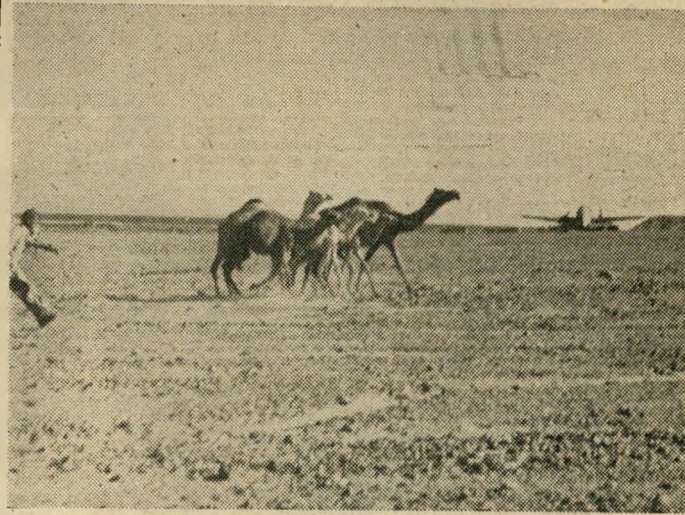
אינצירנט על הגבול העזוב לגרומ לתסביכת בינלאומית - חמשה "מסתננים" בעלי דבשות חצו ברחבה את הגבול מעקבה לאירת, כשמשמר צבאי דוגן אחריהם, וצולמנו דוגן אחרי המשמר.