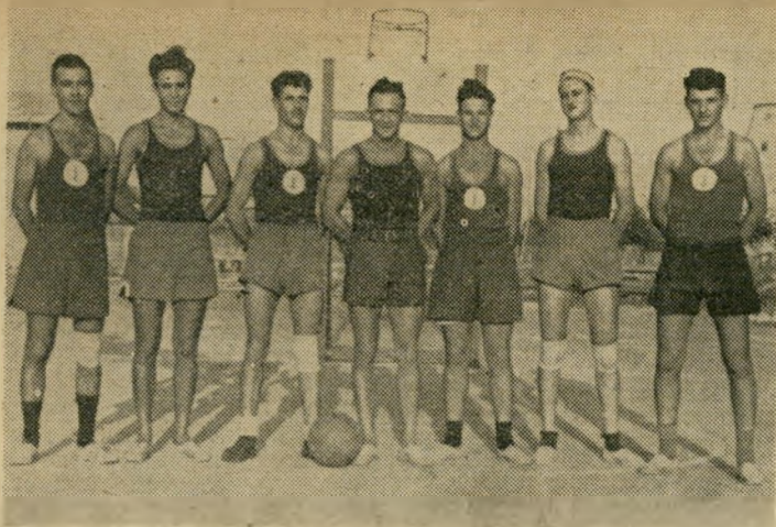
קבוצת הכדורסל של חיל הים הים ניצח ביבשה

כשאנו מנסים לחדור לעמקה של הבעיה, הרינו נתקלים באדישות מוחלטת. המגע הרופף בין מרכזי "מכבי" ו"הפועל" אשם בכך לא במעט והתור צאה היא, כי ציבור החובבים נאלץ להסתפק בהופעות בודדות, פרי יומם פרטית, שאינן לתועלתו של ענף פרי פולרי זה.