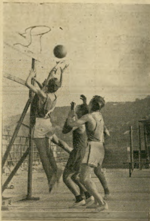
הפתעיות על פי הימאים הצבא והציבילים התידוד

היתה זו כאמור תחרות-מבחן פנימית ראשונה, וכעקבותיה נהיה עדי ים עוד לשורת מבחנים משותפים בין מתאגרפי "מכבי", "הפועל" וה"כח".