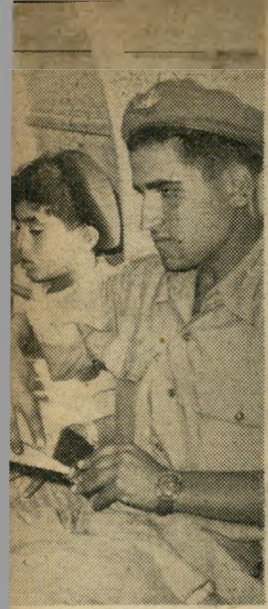
„עוד מעט נגיע!“ ריט