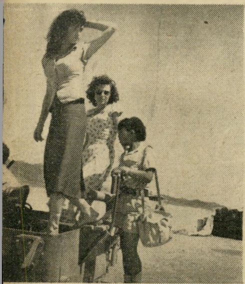
„יא, איזה אלמוג!“ שלית האלמוגים היא הספ פוצעים את הרגל, אך זה כדאי -- גם הפצעים וגם