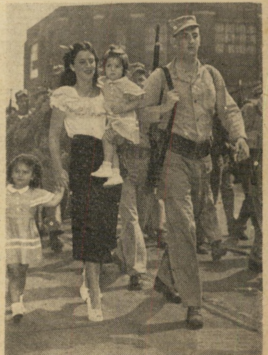
עתודאי אמריקאי נקרא לשרות זלוול באויב.