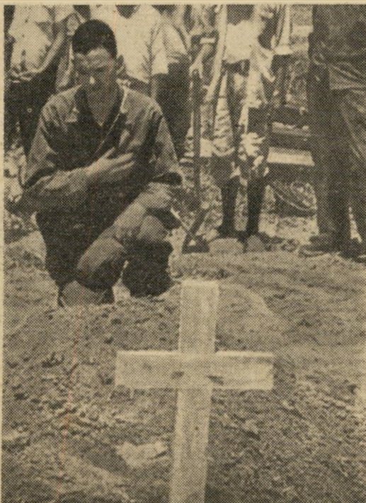
חייל אמריקאי מתאבל על קבר חברו. עולה ביוקר.

עד קדקד, יכול היה לנוע אך בקושי היה דויד קל-תנועה, מסוגל לתמרן במירות ולהפעיל את נשקו הקל בצורה שמנעה מגלית אפשרות של הגנה.