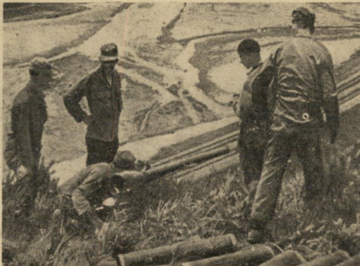
הכאזוקה ה"סודית" נכנסת לפעולה גלית מחפש את דויד.

כשדויד הצפון-קוריאני עבר את הגיבול חיכו האמריקאים בבוז ("ויראה את דויד ויבזהו"). ומתוך בוז לאויב עשו את השגיאה המכרעת הראשונה: במקום לתפוס קו הגנה יציב, להיערך מאחוריו ולהימנע מהיכנס מקרב עד אשר יתקבצו כחותיהם מעבר ליס, שלחו כל יחידה, בהגיעה לקוריאה, שר