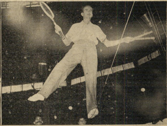
האמן בכלר מראה כוחו ברקוד על החבל.