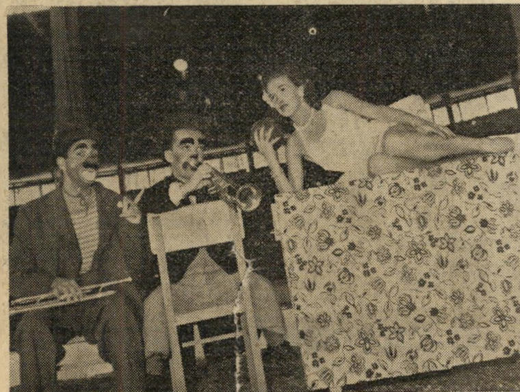
הילצנים ברוק וגודרלי בליות שוקנית חמודה, במערכון חדש מספקים את הצחוק.