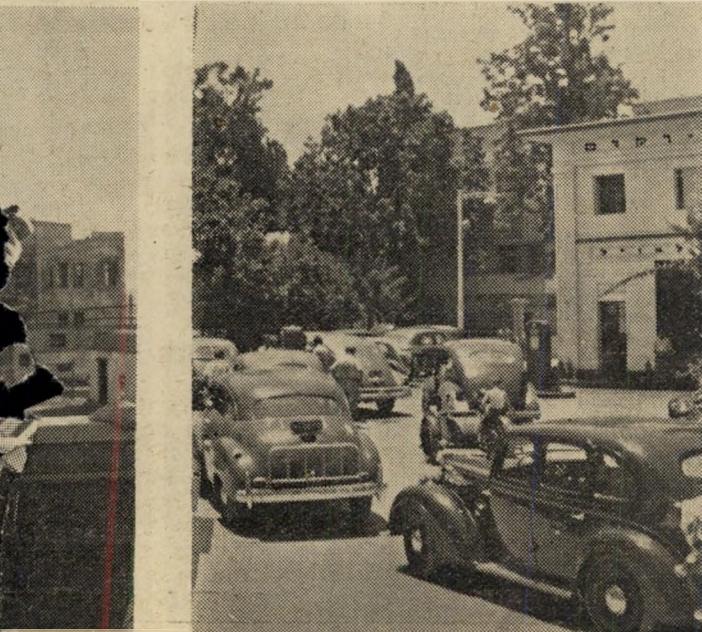
התור לבניזין המכוניות נעצר.