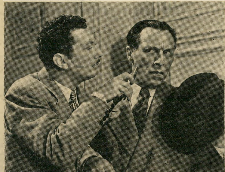
הואי זיובה (אדם וצלו) גאנגסטר מוצלח

"סליחה, טעות במספר" (אה"ב) — אשה נכה (ברברה סטאני וויק) שומעת במקרה שיחה בטלפון בין שני אנשים. האחד מנסה להברור הוראות לרצוח אשה נכה באותו לילה. לאט לאט מתחזר לה שהנרצחת היא — עצמה. "לה בזה" (איטליה) — העלילתה האופרית של האופירה על מגש חדש. נושא נצחי זה הוסרט לפני שנים רבות והוצג בשעתו בשפה הגרמנית. חבי, "קולומביה" הסריטה כעת את הסרט בשפה האנגלית. גם ה-פעם מזמרים את המוסיקה של פוצ'יני יאן קיפורה ומרתה אגרט. "אי שם באירופה" (הונגריה) — ילדי אירופה הדויה, יתומי מלחמה, תועים בדרכים עד אשר הממשלה אר-ספת אותם ומשכנת אותם על חשבונה. מעין מהדורה הונגרית של "הדרך לחיים".