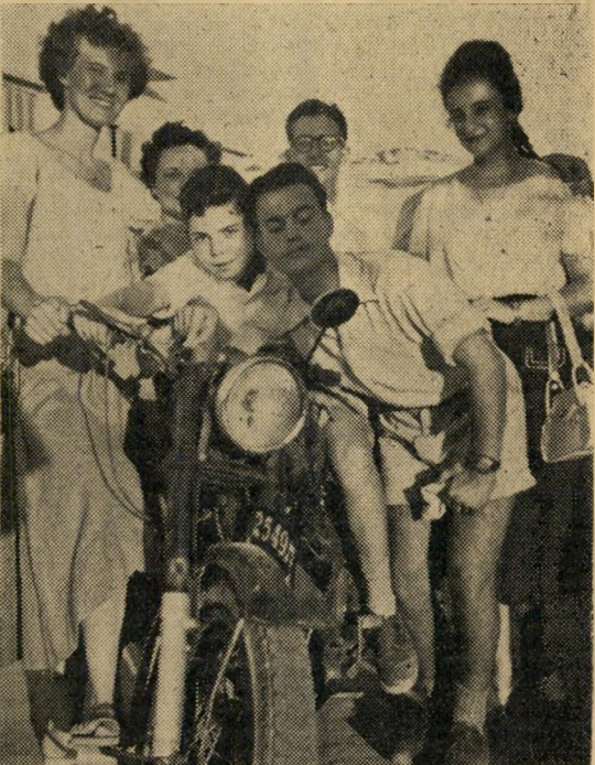
השניחות האמריקאית וינדי רמת-גן אידיאליזם...

מטרתה, היו יריביהם חיילי צ. ה. ל. לשעבר (הלבושים חאקי מתוך הרגל ואולי מתוך חוסר בגדים), המכות היו עוות, היו כמה פצועים, ולבסוף הזכיר המחזה ספק תמונה מתוך סרט בלשי, כפק נסיגה מסודרת לקיום חדשים — מכונית המשטרה טסה בכוח בית הסו"ר הר מכונית צבאית דלקה אחריה... בסגנון הגבוה המקובל מאד בי"מינו נקרא הדבר "בעית הדיוור". במק"רה הנידון היה זה חדר, שבו שכנה לשעבר קנטינה של שוטרים בריטיים. לחדר זה הוכנס (ע"י האפורופוס על רכוש הנפקדים) יומיים קודם לכן זוג עולים, אולם קבוצת חיילים משוחררים בתענה משום מה את הזכות על המ"קום. עוד טרם הספיק הזוג לחמם את המקום, באו מחוסרי גג אלה והוציאו"ם מהמקום על חפציהם ומטלטליהם. הוועקה למקום קבוצת שוטרים, אך החיילים התנגדו. ניתן להם אולטימטום של כמה שעות לעבור ל"קיום חדשים", ומשסתיים הזמן הקבוע ו"הפולשים" לא יצאו, החל המאבק על המקום. תחילה היתה ידם של החיילים המ"שוחררים על העליונה, אך לפתע באה גבורת. במקרה הזדמנה למקום חולית