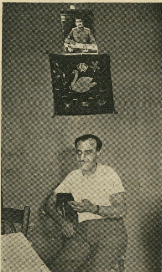
פרים אהאנס מרדירם סטלין, אצל ולח'...

התמונות המועזעות של התאונה, ה' מתפרסמות בגליון זה, מעוררות שוב שאלה בעלת חשיבות אנושית עמוקה: מה אחריותה המוסרית של חברה מוג' פוליטית כ-"דן" לגבי קרבנות תאונות?