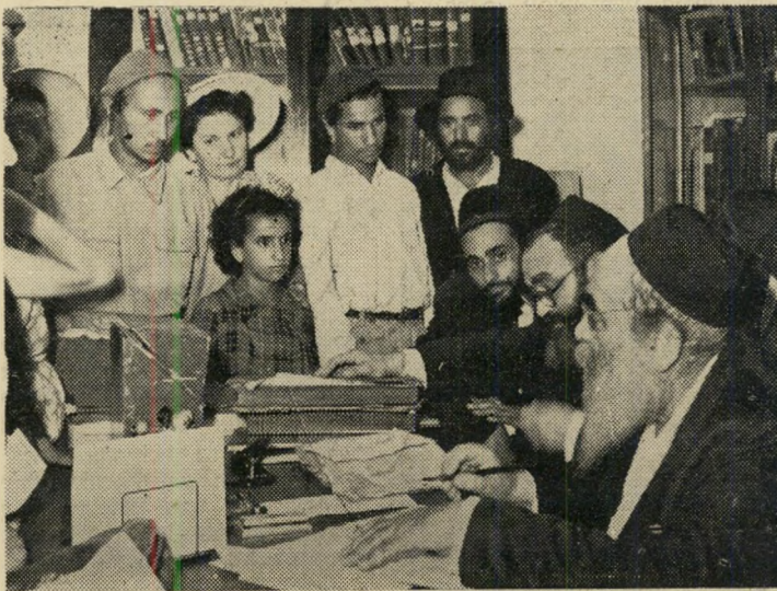
"ג"ט" זכרנה מוזעם בת הי"א, האשה הפכה ילדה