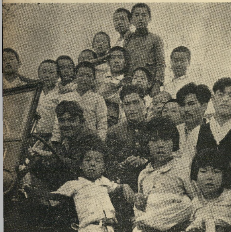
מרחק 40 ק"מ משדה הקרב. ילדי קוריאה משחקים בני-יפ. האמריקאי. למטה: אכרים מבני קוריאה הדרומית מקימים קו-ביצורים לאמריקאים.