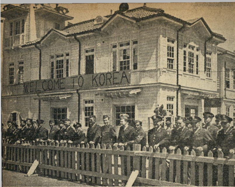
„ברוכים הבאים!“ -- יחידות חיל-הרגלים אמריקאי הגיעו לקוריאה.