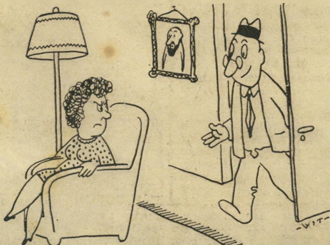
"לא השגנתי כרטיסים לזיגני וויסנברג, אבל נוכח ללכת למשפט עקובוביץ'..."

בפרס של לירה אחת זוכה בעל הבית דיחה הנדפסת ראשונה במדור. בדיחות יש לשלוח לת. ד. 136, ת"א.