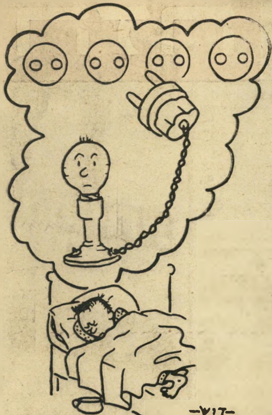
חלום הכלחות של בעית החנוך

שני גנבים החליטו לסלק עצמיהם מעל מרפסת. עלה אחד והורידם, אחד אחד, ומסרם לשני שעמד ברחוב. פתאום עבר שוטר, ושאל: "הי, מה זה פה?"