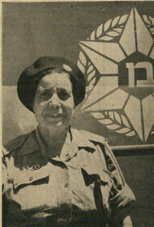
השוטרת חנה בדיחה 37. ל"ז זב אשה

אחרי "מר ישראל" ומלכת היר-פי של ישראל" עורך אחד השבועונים תחרות חדשה: מלכת חוף הים. מאחר ששפת-הים שלנו נסגרה, האם לא היה מוטב לקרוא להתחרות: "מלכת האמ"בטיה"?