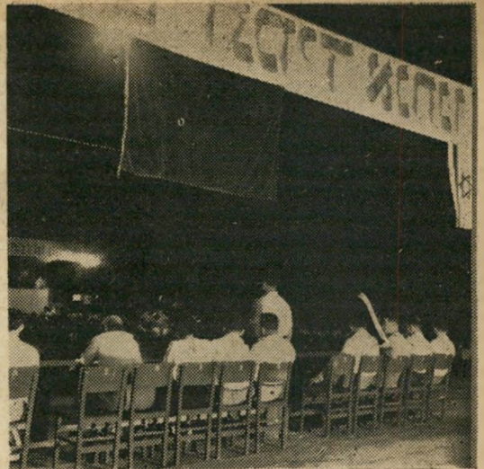
כינוס הפלמ"ח: יגאל אלון נואם "לא יורידונו מן הבמה..."