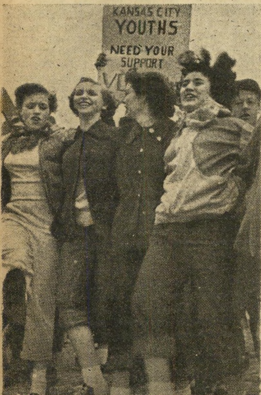
תלמידי קאנזס סיטי מפגינים האזרחים העלו את המסים.

* כוכבי-הקולנוע אן שרידן סבורה שהנשים של ימינו מראות את מעורר מיהן במידה רבה מדי. „עלינו לעשות משהו, אחרת יחדלו הגברים לשרוק בראותם אותנו...”