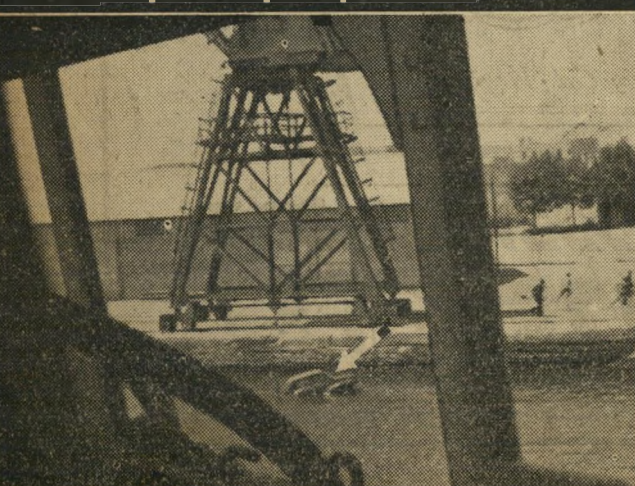
ההמון ביקש פורקן להתרגשותו וזר הימה את מכוניתו של סוכו אניות ז