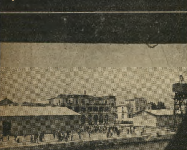
ה„שבאב“ ניתק את החבלים. האניה מתרחקת מן ההמון