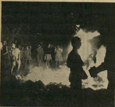
ל"ג בעומר בירושלים "כבאים? מוסד אפיקורסי?"