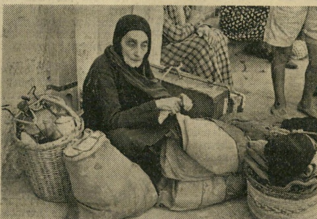
ל"ג בעומר בצפת "בתי מלון? מה זה?"

אחר כך תהיה הצבעה, ולמפא"י — רוב הקולות.