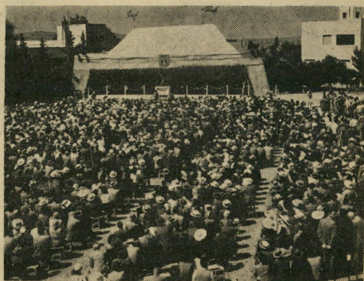
יובל האוניברסיטה העברית פתיחה פורמלית