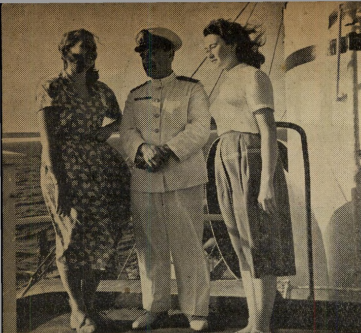
שיחה עם רביהחובל אינעור חודרוב — אם לדון לפי הבעת הפנים, אין הוא מרצה ליונה על תורת הימאות...