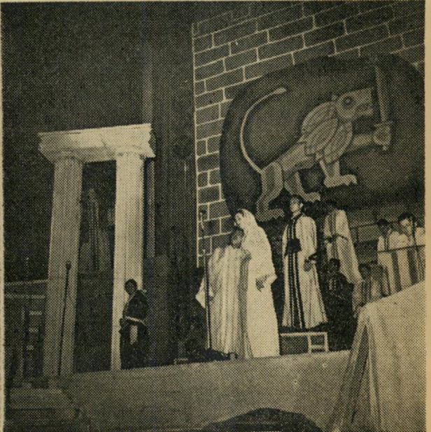
מגילת העצמאות ב"הקת הכרמל" הבית השני נחרב...