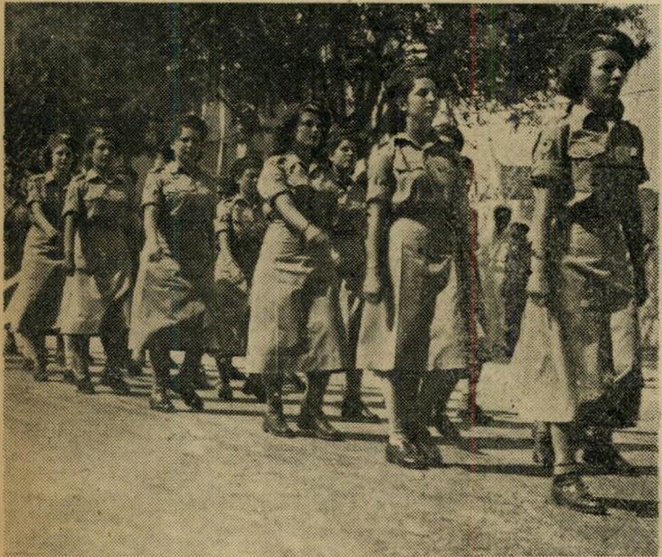
רחש האוויר... המטרה לנגד עינינו.