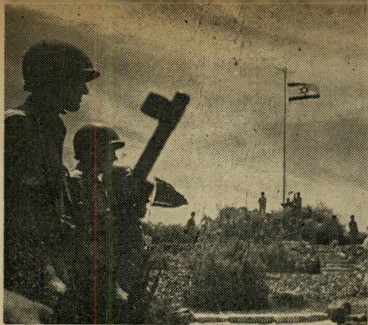
הרוכה והדגל באזכרת חיל האוויר צל העבר, איום העתיד.

הלפיד מגיע לקרית-ענבים! הלפיד בידי חבר קבוצת „הפועל“ שניצחה במרוץ וזכתה לדגל הקסטל. נשיקה, רוצים לצלם? אהלן לנו לא איכפת. להיפך. „חבריה, הצטלמתי. הצטלמתי.“ לקול הצהלה מגיחים מן האפ-לה זוגות אחרים, שהיו חבויים אי שם. גם הם רוצים להצטלם. „איזה פוזה אתם רוצים?“ דבר טבעי בהחלט. אין מה להתבייש. לשם מה ברא אלוהים