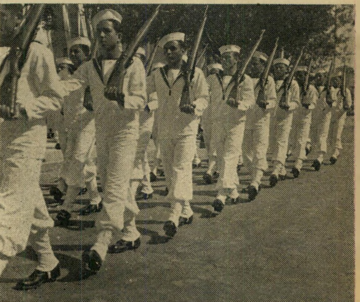
המית הגלים... בשורות מלכדות לקראת...