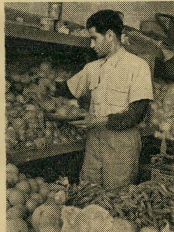
ירקן שלום מאזאיה שומן, סולת וזבל

"לא, אדוני, בהחלט אינו רוצה לעזוב את הארץ. למה לי? היכן ארגיש את עצמי בטוב כמו כאן, בתל אביב?"