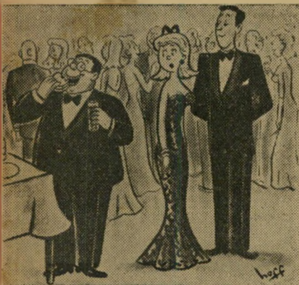
בעלי קנאי מאד-מאד. אלפרד... אלפרד...