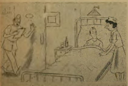
מה אתה מודאג כל כך? הרופא די מודאג ממעך...