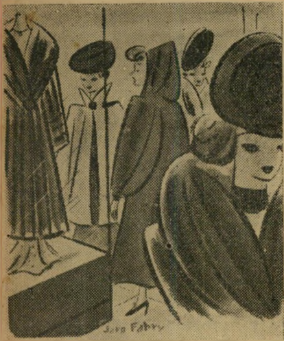
— כבר חסכתי לי את הסכום הדרוש למס קניה, עתה אתחיל לחסוך עבור הפרווה עצמה...