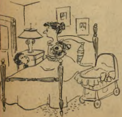
אני רוצה באח גדול יותר.

אל ערשי הלהטים דב יוסף פרסם צו האוסר על הקוס' מים ועושי הלהטים להוציא ממגבעו תיהם שפונים, תרנגולות וכו', בטענה שלהטים אלה משאירים השפעה רעה בקרב קהל הצופים.