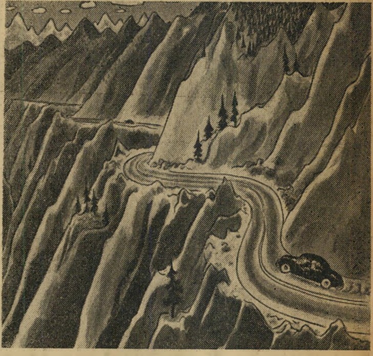
ההרים האלה, מזכירים לי את המחירים, הם עולים — עולים מעלה-מעלה!