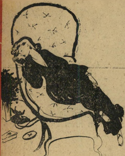
בודאי אשתו מפיצה עלי את השמועות שהן אמת...