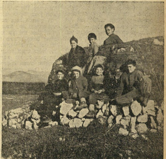
בקשוני לכתוב כאן: "הבנדה של מטולה".