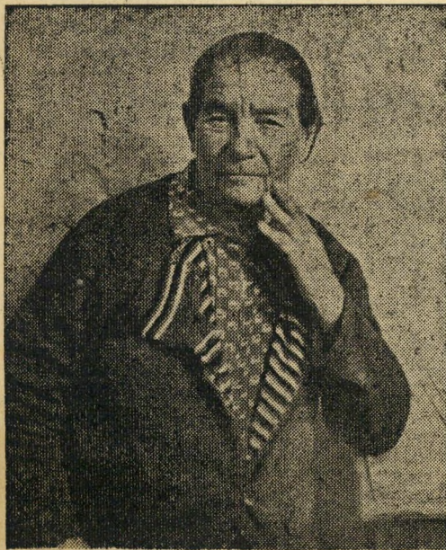
"שלושים שנה חייתי במשמר הירדן ועשרים ושמונה שנה אני במטולה." אומרת גב' אמית.