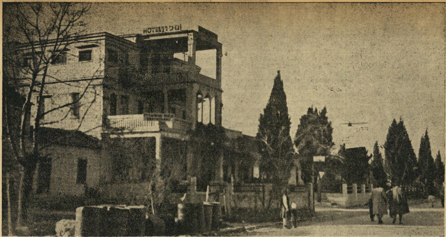
אחד מבתי המלון במטולה.