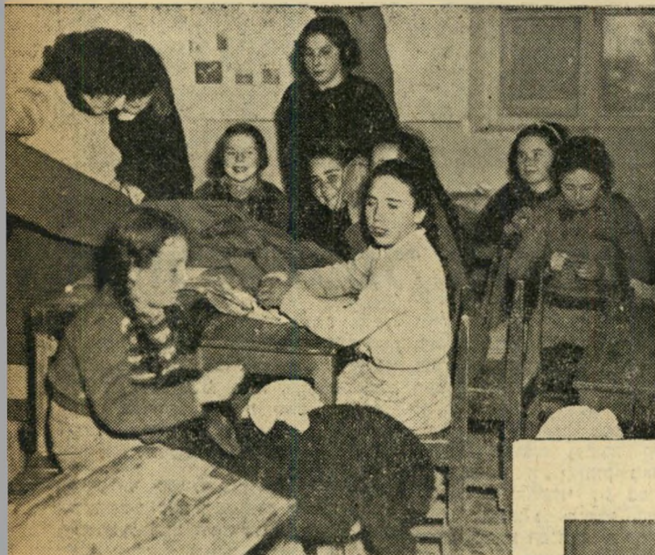
הדרכה בעבודת יד בבית הספר של הכפר. גם באה לבית הספר יחד עם האחים הצעירים התלמידות.