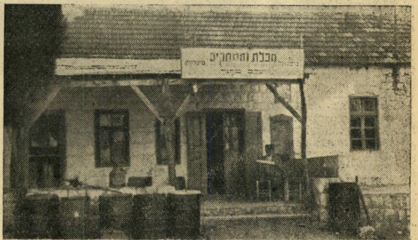
חנות "כליבו" של מטולה.