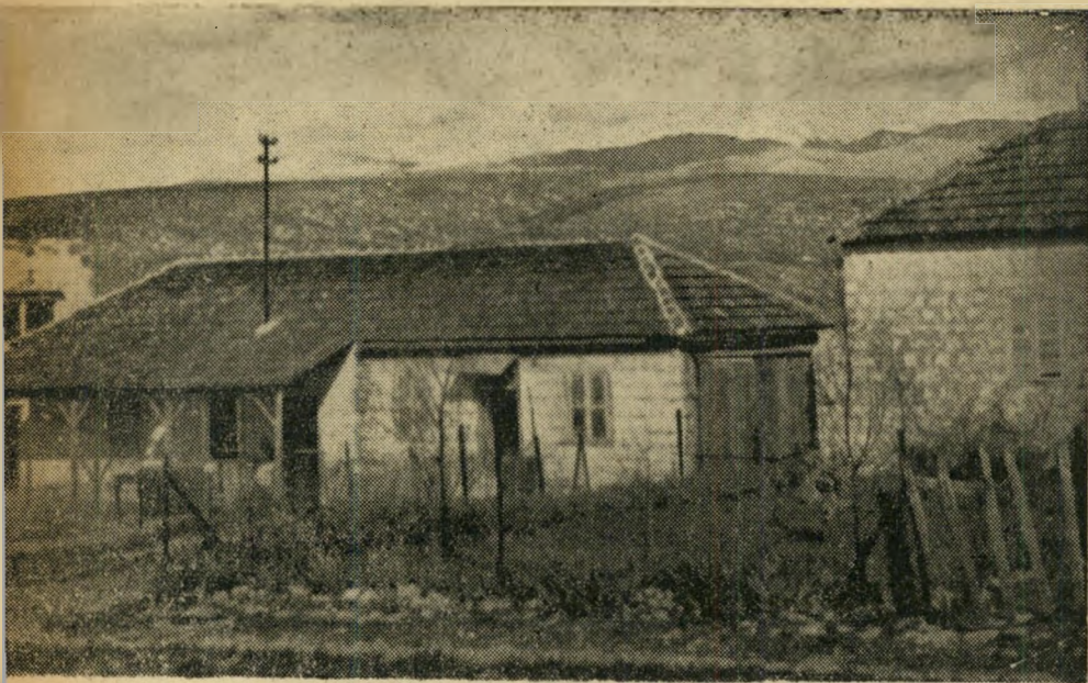
הבית הישן שומר עדיין על הרוח של הציונות הרומנטית מימי הברון רוטשילד