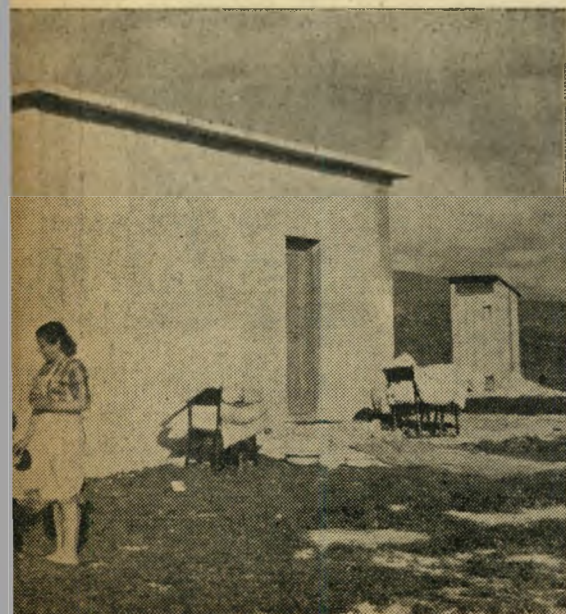
בית חדש במטולה, בית של ע