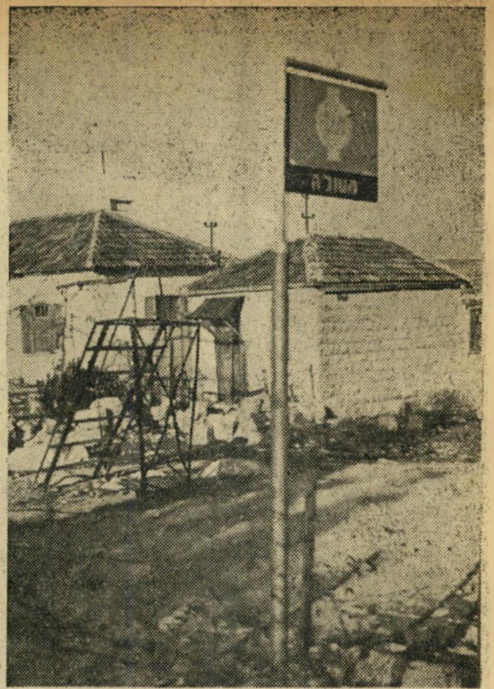
תחנת "אגד" יש מקום לסוכה נאה במקום זה המיועד לתורים ומבריאים, אך לעת עתה עומד במקום סולם ברזל בלבד.